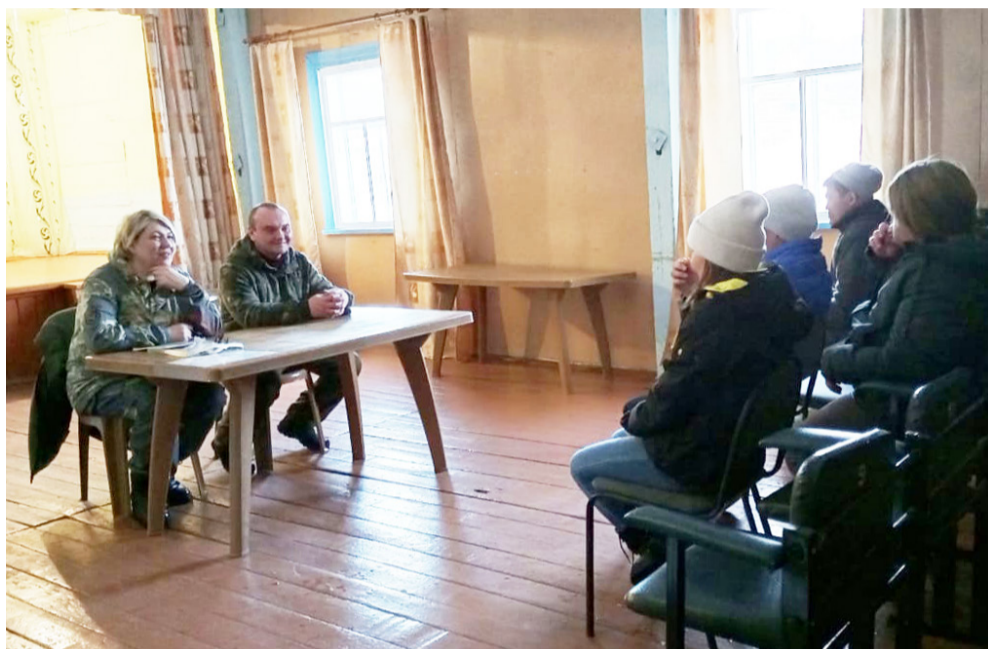
На фото: встреча с жителями с. Хамакар