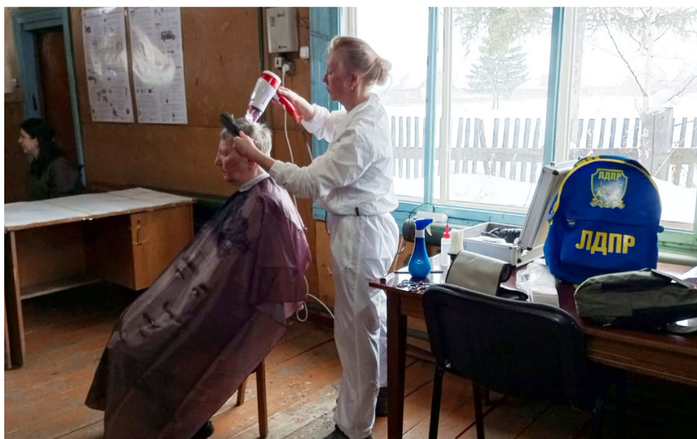
На фото: бесплатный прием парикмахера в с. Наканно