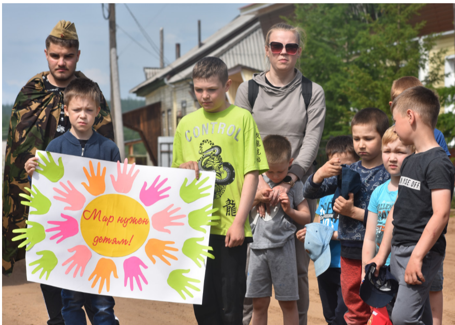
На фото: участники памятного мероприятия

В душный, жаркий полдень 22 июня, к скверу Памяти в центре Ербогачёна собрались люди – женщины, мужчины, пожилые и юные, детвора. Все держали в руках яркие цветы. Они пришли почтить память даты огромной скорби. Дня начала Великой Отечественной войны.