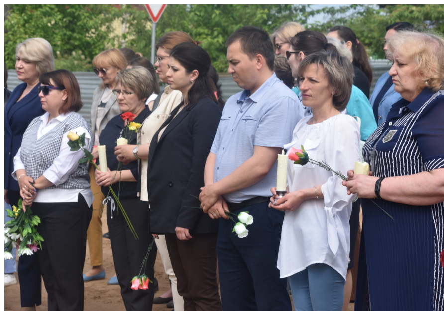
На фото: участники памятного мероприятия