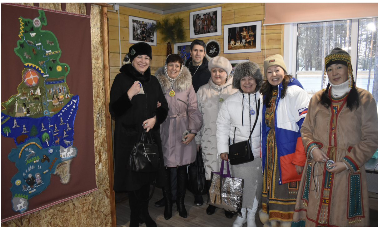
На фото: гости и организаторы торжественного открытия этнокультурного комплекса «Урикит»

Со времени начала строительства минуло несколько месяцев, и вот участники ЭНКЦ могут с полным правом сказать: «Мы строили, строили и, наконец, построили». У музея под открытым небом, созданного руками и знаниями самих носителей культуры, при помощи спонсорской поддержки, есть все шансы стать одним из центров притяжения не только Ербогачёна, но и всего Катангского района.