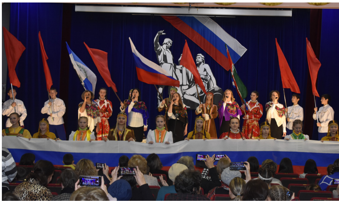
На фото: завершающий номер концертной программы в ДК «Созвездие», всеобщее исполнение песни «Россия - это мы» и демонстрация флагов

В целом, праздничная программа ДК «Созвездие», как всегда, порадовала красочными, запоминающимися номерами и подарила незабываемые впечатления и эмоции зрителям. Особая атмосфера концерта