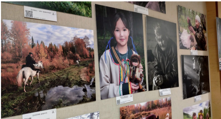
На фото: часть выставочных экспозиций «Малой родины» в ДК «Созвездие»

Эвенки – оленные люди, идущие поперёк хребтов. Вечные кочевники и охотники – вокруг них огромный мир, который сотрясают войны, эпидемии и революции, а они тысячелетиями