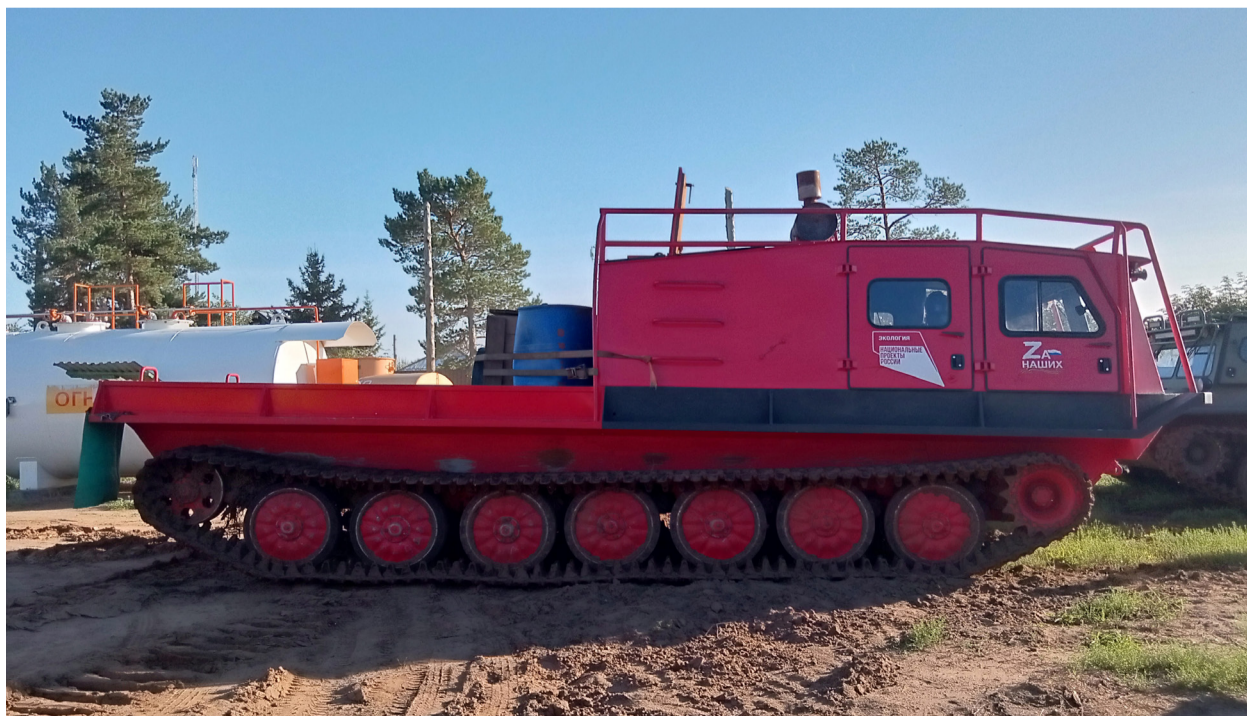
На фото: один из вездеходов ЛПС-2, поступивших в 2023 году