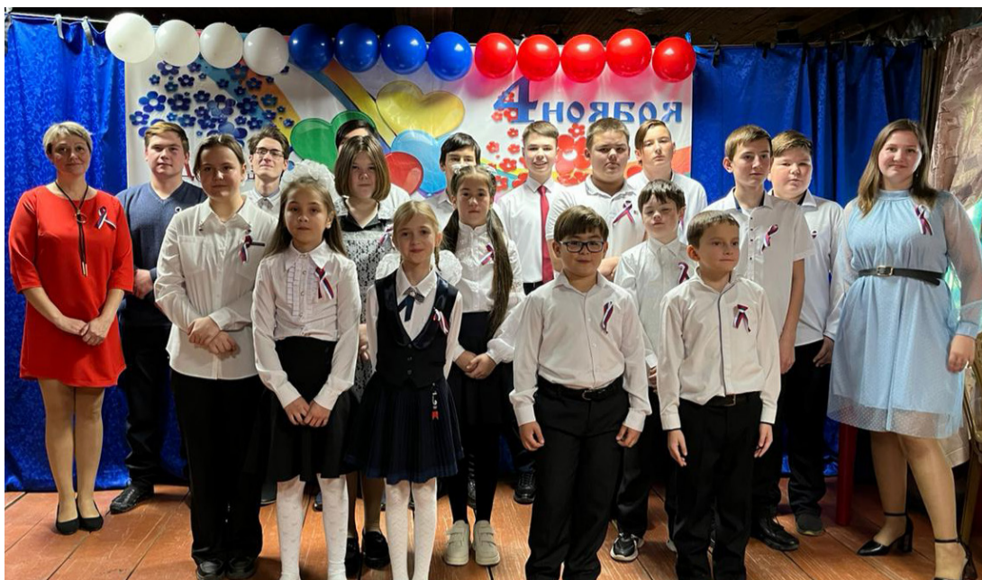
На фото: участники концерта «Единым духом мы сильны» в с. Преображенка

От лица всех зрителей, благодарим организаторов концертов в с. Ербогачен и с. Преображенка за прекрасную атмосферу и