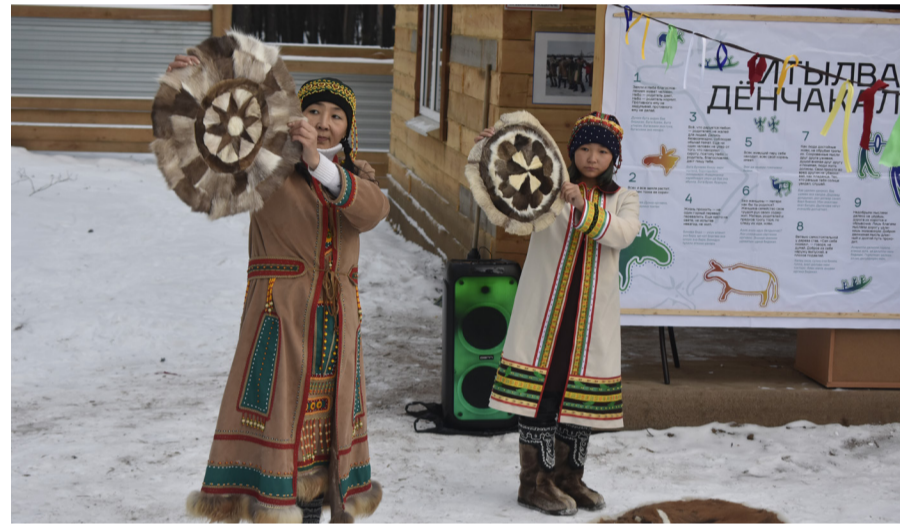
На фото: участники ЭНКЦ исполняют национальный танец

Праздничное настроение царило на протяжении всего открытия «Урикита». Гости с интересом смотрели фото и видеоматериалы, сделанные иркутскими журналистами Борисом Слепнёвым и Константином Куликовым во время путешествия на эвенкийское стойбище.