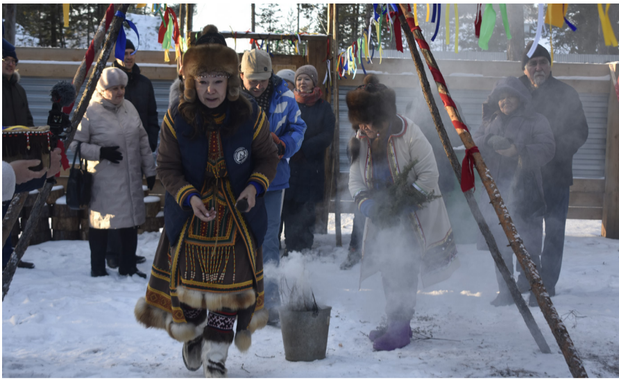
На фото: гости проходят эвенкийский обряд очищения дымом

рук и принимали любую помощь. Будь то содействие администраций Катангского района и Ербогачёнского поселения, или помощь простых, равнодушных катангчан.